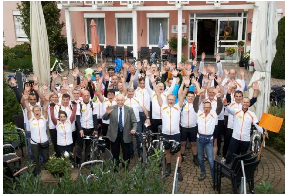
„Geschafft!": Ankunft in Kusel