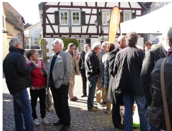
Reges Treiben bei den „Marktgesprächen“ auf dem Wochenmarkt in Rockenhausen