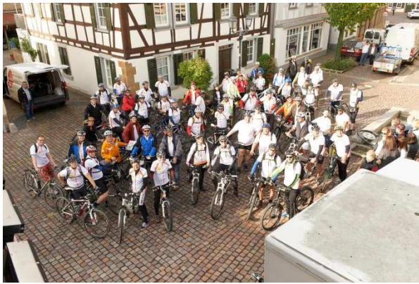
„Los geht's!": Start in Rockenhausen

Nach einer Stärkung wurde die Radtour nach Brücken fortgesetzt und fand schließlich in Kusel ihren Abschluss. Hier wird 2017 die 2. Zoar-Radtour in Richtung Heidesheim beginnen.